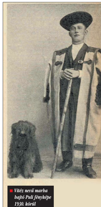
■ Vitéz nevű marha hajtó Pulikó fényképe 1930. körül

Marhahajtás során a puli nem fizikailag akar győzni, hanem rákényszeríteni az akaratát a gulyára. Ezért cselhez folyamodik, hogy a gulyát a kívánt irányba készítse. Természetesen alkalmaz fizikai ráhatást is, hiszen nyomatékkal a marha orrába csíp, vagy a farkát húzza, de nem azért, hogy leterítse, megölje. Azzal tökéletesen tisztában van, hogy fizikailag egyedül esélytelen több marha összefogott tonnányi erejével. Mégis akarata győzedelmeskedik, mert intelligensebb. A gulyát egy kerek egésznek tekinti, tehát nem egy marhát szemel ki bikaheccként közülük, hogy azt legyőzze, hanem a célja a gulya egészének mozgatása.