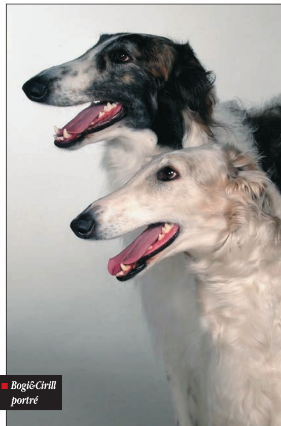
■ Bogi&Cirill portré

– Az Amuri-Pajkos Kennel alapítására 1995 tavaszán, 20 évesen szántam el magam. Akkortájt a PANNON Agrártudományi Egyetem Állattenyésztési Karára jártam és szabadidőm legnagyobb részét a fajta történetének megismerésére fordítottam. Diplomadolgozatomat Az orosz agár tenyésztés jelene és jövője a versenyek és kiállítások függvényében címmel írtam. Témaválasztásomban és a tenyésztés elkezdésében az motivált, hogy ez a nagyszerű tulajdonságokkal